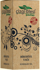
BİBERİYE YAĞI - 20 cc - Ürün Kodu: 3307

*Kabızlıkta, *Selülitte, *Bağışıklık sistemini güçlendirmede, *Kötü kolesterolün düşürülmesinde, *Kalp ve damar hastalıklarında, *Böbrek kum ve taşlarının düşürülmesinde, *Sedef ve egzamada, *Yaşlanma belirtilerini yavaşlatmada, *Hücre yenilenmesinde ve cilt bakımında yardımcı ve destekleyicidir.