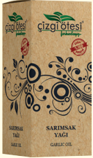
SARIMSAK YAĞI - 20 cc - Ürün Kodu: 3342

*Balgamda, *İltihapta, *Krampta, *Soğuk algınlığında, *Hazımsızlıkta, *Mide şişkinliğinde, *Menopoz dönemi sorunlarında, *Kemik erimesinde, *Bağırsak hastalıklarında, *Gaz sorunlarında, *Anne sütünü artırmada, *Selülitte, *Cilt yüzeyindeki pürüzleri gidermede ve cildi beslemede, *Göğüs büyütmede, cildi dolgunlaştırmada Anason, Çörekotu, Keten Tohumu ve Mersin yağı ile birlikte kullanıldığına yardımcı ve destekleyicidir.