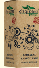
PORTAKAL KABUĞU YAĞI - 20 cc - Ürün Kodu: 3339

*Öksürükte, *Balgamda, *Migrende, *Stres ve depresyon durumlarında, *Nefes darlığı ve veremde, *Bağırsak yaraları ve iltihabında, *Kabızlıkta, *Göz karamalarında ve gözün görme gücünü artırmada, *İltihaplı romatizma ve kireçlenme ağrılarında, *Eklem ve kas ağrısı, burkulma, kısılma, zedelenme ve boyun ağrısında, *Adele sertleşmesinin giderilmesinde yardımcı ve destekleyicidir. *Doğal bir deodoranttır.