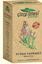
FUNDA YAPRAKLI Bitkisel Çay (KÜR) - 130 gr - Ürün Kodu: 1107

İÇİNDEKİLER: Hindiba, Şahtere, Biberiye, Rezene, Ayrıkotu, Sarı Kantaron, Civanperçemi, Oğulotu, Kereviz Tohumu. FAYDALARI: *Karaciğer işlevlerini düzenleme, *Karaciğer tembelligi ve yağlanmasını gidermede, *Hepatit ve sarılıkta, *Karaciğere bağlı cilt sorunlarında, *Sindirim sistemini düzenleme, *Kanı temizleme ve kan dolaşımını düzenleme, *Mide kramplarında, *İltihap kuрутmada yardımcı ve destekleyicidir.