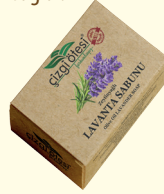
LAVANTA SABUNU - 100 gr - Ürün Kodu: 4415

*Saç derisini temizleyerek kepeklenmenin giderilmesini ve sağlıklı deri oluşumunu sağlar. *Antiseptik ve antibakteriyel olduğundan sivilce ve yağlanmayı giderir. *Cilde ve saç köklerine mikroorganizmaların yerleşmesini engeller. *Siyah noktaların, sivilcelerin ve aknelerin oluşmamasını sağlar. *Akne, mantar, egzama ve sefede gibi cilt sorunlarının giderilmesinde yardımcı ve destekleyicidir.