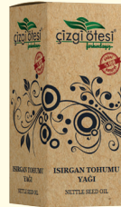
ISIRGAN TOHUMU YAĞI - 20 cc - Ürün Kodu: 3319

*Kabızlıkta *Sinüzitte, *Baş, karn, mide ve kas ağrılarında, *Eklem ve romatizma ağrılarında, *Kesik ve sıyrıklarda, *Yara ve yanıkta, *Deri döküntülerinde, *Tırnak kırılmasında, *Saçkıran tedavisinde, *Saç, kirpik ve kaşları güçlendirmede, dökülmelerini önlemede, *Cilt temizliğinde yardımcı ve destekleyicidir.