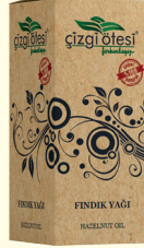
FINDIK YAĞI - 20 cc - Ürün Kodu: 3313

*Nefes darlığında, *Öksürükte, *Soğuk algınlığında, *Kan şekerini dengelemede, *Romatizma ve adele ağrılarında, *Bademcik iltihabı ve gribal enfeksiyonlarda (Gargara şeklinde uygulandığında), *Mantarda, *Saç, kaş ve kirpiklerin hızlı uzamasında, *Kas gevşetmede, göğüs yumuşatmada, gaz gidermede, mikrop öldürmede ve terletmede yardımcı ve destekleyicidir.