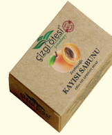
KAYISI SABUNU - 100 gr - Ürün Kodu: 4412

*Saçları besler, gözenekleri açar ve cildi temizler. *Düzenli kullanımda kepeği, kırılmayı ve yağlanmayı önler. *Saçlara parlaklık ve yumuşaklık verir. *Ölü derileri temizler ve cilde pürüzsüz bir görünüm kazandırır. *Cildin canlı ve parlak bir görünüm kazanmasına yardımcı olur.