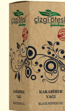
KARABİBER YAĞI - 20 cc - Ürün Kodu: 3323

*Prostatta, *Bağırsakları yumuşatmada, *Kabızlıkta, *Kurt ve şerit düşürmede, *Toksinlerin atılmasında, *Bağırsıklık sisteminin güçlenmesinde, *Enfeksiyonlu hastalıklardan korunmada, *Sedef ve egzama gibi cilt hastalıklarında, *Cildi yumuşatmada ve dolgunlaştırmada, *Göz çevresindeki yaşlanma etkilerini azaltmada yardımcı ve destekleyicidir.