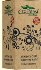
BUĞDAY ÖZÜ (Ruşeym) YAĞI - 20 cc - Ürün Kodu: 3308

*Romatizmal ağrılarda, Gutta, *Kansızlıkta, kalp çarpıntısında, *Kötü Kolesterolde, *Karaciğer rahatsızlıklarında, *Uyku düzensizliklerinde, *Astım, Bronşit ve Koahta, *Migren, Melankoli, Depresyon, Sürmenaj ve Asabiyette, *Sinüzitte, Kurt dökmede, Ağız ve Diş sorunlarında, *Kabızlık ve sindirim sistemi sorunlarında, *Saç dökülmesi ve kepeklenme sorunlarında, *İdrar söktürme, gaz giderme ve kan dolaşımını düzenlemede, *Cilt temizliği ve bakımında yardımcı ve destekleyicidir.