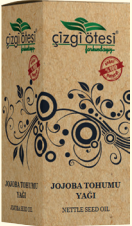
JOJOBA TOHUMU YAĞI - 20 cc - Ürün Kodu: 3320

*Cilt kırıksıklıklarında, *İltihaplı egzamada, *Selülit tedavisinde, *Akneleri gidermede, *Cildin nem dengesini sağlamada, *Ciltteki yanmayı ve dökülmeyi hafifletmede, *Sivilceli, lekeli ve yıpranmış ciltlerin bakımında, *Doğum sonrası çatlakların giderilmesinde, *El ve ayak çatlaklarında, *Cilde esneklik kazandırarak ayak, karnı ve bacadaki çatlakları gidermede ve önlemede, *Saçların güçlenmesini, uzamasını ve kolayca şekillenmesini sağlamada, *Saçta kepek oluşumunu önlemede, *Saça parlaklık ve yumuşak kazandırmada, *Göz makyajı dahil olmak üzere cildin temizlenmesinde yardımcı ve destekleyicidir.