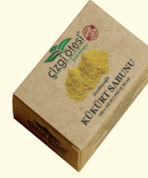
KÜKÜRT SABUNU - 100 gr - Ürün Kodu: 4414

*Kusursuz bir peeling ürünüdür. *Cildi derinlemesine temizler, akne ve siyah noktaları giderir. *Cildi canlandırır, vücudun forma girmesine yardımcı olur. *İçerdiği mineraller sayesinde saç ve cilde doğal yumuşaklık ve parlaklık kazandırır. *Tüm ciltlerde sıkılaştırıcı, besleyici ve toksinlerden arındırıcı etki sağlar. *El ve ayaktaki çatlakları yumuşatıp, gidermeye yardımcı olur. *Ölü derileri temizler ve cilde pürüzsüzlük kazandırır. *Saçların kolay şekil almasını sağlar.