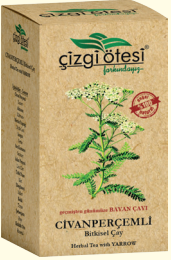
geçmişten günümüze BAYAN ÇAYI

İÇİNDEKİLER: Biberiye, Funda Yaprađı, Sinameki, Anason, Ardıç, Defne Yaprađı, Mersin Yaprađı, Rumi Papatya, Rezene, Şahtere, Kekik, Meyan Kökü, Bamyra Çiçeđi. FAYDALARI: *İştah kesmede, *Kabızlıkta, *Sindirimi kolaylaştırmada, *Metabolizmayı hızlandırarak kalori tüketimini artırmada, *Vücutun yağ depolamasını önlemede, *Kan şekeri, tansiyon ve kolesterolü dengelemede, *İdrar söktürme ve ödem atılımda, *Mide ve bađırsaklardaki gaz sorununu gidermede, *Böbrek kumu ve taşlarının düşürülmesinde, *Kilo vermede yardımcı ve destekleyicidir.