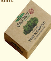
YOSUN SABUNU - 100 gr - Ürün Kodu: 4418

*Saç köklerini besleyerek saçları güçlendirir ve dökülmesini önler. *Saçları yumuşatır ve doğal parlaklık kazandırır. *El, yüz ve vücut temizliğinde derinlemesine temizlik sağlar ve cildi güzelleştirir. *Cilt yenileyici ve kepeklenmeyi önleyicidir. *Kuru ciltleri canlandırır ve parlak bir görünüm kazanmasını sağlar. *Hassas ve alerjik ciltlerde güvenle kullanılabilir. *Doğal ve saf yapısı sayesinde tüm saç ve cilt tipleri için uygundur.