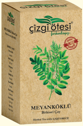
MEYAN KÖKLÜ Bitkisel Çay (KÜR) - 130 gr - Ürün Kodu: 1110

İÇİNDEKİLER: Meyan Kökü, Defne Yapağı, Ebegümesi, Kırkkilit Otu, Mısır Püskülü, Rumi Papatya, Zeytin yapağı, Kiraz Meyve sapı. FAYDALARI: *Böbrek rahatsızlıklarında, *Böbrek taşı ve kumarının düşürülmesinde, *Safr Kesesi sorunlarında, *Kanı temizlemede, *İdrar söktürmede ve iltihap kurutmada, *İdrar yolları enfeksiyonunda, *Sindirimi düzenlemede yardımcı ve destekleyicidir.