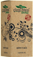
HİNT YAĞI - 20 cc - Ürün Kodu: 3318

*Kabızlıkta, *Kansızlıkta, *İshalde, *Böbrek ağrılarını dindirmede, *Anne sütünü artırmada, *Astım, bronşit ve veremde, *Ses kısıklığını gidermede, *Dişetini kuvvetlendirmede, *Bağırsak iltihabında ve kanamalarında, *Görme bozukluğu ve gece körlüğünde, *Zararlı ışınlarla karşı cildi korumada, *Yüz ve boyun kırışıklıklarını gidermede, *Cildi onarmada ve cilde canlılık kazandırmada yardımcı ve destekleyicidir.