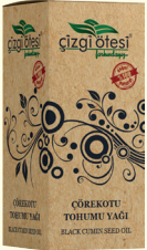
ÇÖREKOTU TOHUMU YAĞI - 20 cc - Ürün Kodu: 3311

*Solunum yolları sorunlarında, *Bel soğukluğunda, *İdrar yolu enfeksiyonlarında, *Astım, bronşit, şeker ve romatizma tedavisinde, *Grip döneminde bağışıklık sistemini güçlendirmede, *Vücutun dirençli tutulmasında, *Hemoroid (Basur) tedavisinde, *İştahsızlıkta, *Kan dolaşımını düzenlemede, *Adet (regl) sorunlarında, *Anne sütünü artırmada, *Kepeklenme ve saç dökülmesi sorununun giderilmesinde yardımcı ve destekleyicidir.