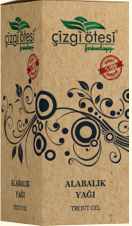
ALABALIK YAĞI - 20 cc - Ürün Kodu: 3303

*Kan şekerini düşürmede, *Kolesterol ve tansiyonu dengelemede, *Kemik erimesini sorununda, *İdrar yolları iltihabında, *Stres, sinir ve uykusuzlukta, *Kabızlıkta, *Öksürükte, *Zihinsel ve bedensel yorgunlukta, *Tenya ve kılkurdu düşürmede, idrar söktürmede, *Kuru ve çatlak cilt sorunlarının giderilmesinde yardımcı ve destekleyicidir.