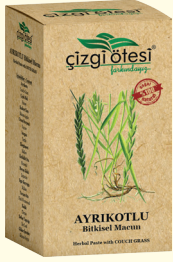
AYRIKOTLU Bitkisel Macun (KÜR) - 420 gr - Ürün Kodu: 2201

İÇİNDEKİLER: Ayrikotu, Kudretnarı, Civanperçemi, Defne Yaprağı, Çiçek Balı, Ebegü-meci, İsrırgan Otu, Kırıkkilitotu, Meyan Kökü, Sığırkuyruğu, Yavşan, Kekik, Glikoz Şurubu. FAYDALARI: *İç ve dış hemoroit (basur)'te, *Basur memelerinin giderilmesinde, *Mide ve bağırsakların düzenli çalışmasında, *Hazımsızlık ve kabızlık'ta, *Anüste yanma, acı, kaşıntı ve sancıyı gidermede, *Kanı temizlemede, *Kalın bağırsak iltihabında ve kanamalarında, *Sindirim sistemi sorunlarının giderilmesinde, *Bağırsak parazitlerini temizlemede ve kolitte, *Yara iyileştirmede yardımcı ve destekleyicidir.