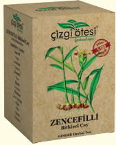
ZENCEFİLLİ Bitkisel Çay (KÜR) - 100 gr - Ürün Kodu: 1113

İÇİNDEKİLER: Sarı Kantaron, Oğulotu, Alıççiçeği, Rezene, Ebegümesi, Bamyacıçeği, Şerbetçiotu, Tıbbi Nane. FAYDALARI: *Stres, panikata ve aşırı heyecanda, *Zihinsel yorgunluğu gidermede, *Migren ve gerginlikte, *Uyku düzensizliklerinde, *Korku, endişe, huzursuzluk ve orta dereceli depresyonda, *Depresif ruh hali tedavisinde, *Menepoz dönemi stresini gidermede, *Stres kökenli mide kramplarını ve bulantılarını gidermede, *Melankoli, Depresyon, Sürmenaj ve Asabiyet'te, *Vücutta canlılık ve zindelik kazandırmada, *Vücudu sakinleştirmede ve kas gevşetmede yardımcı ve destekleyicidir.