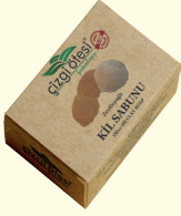
KİL SABUNU - 100 gr - Ürün Kodu: 4413

*Kusursuz bir peeling ürünüdür. *Cildi derinlemesine temizler, akne ve siyah noktaları giderir. *Cildi canlandırır, vücudun forma girmesine yardımcı olur. *İçerdiği mineraller sayesinde saç ve cilde doğal yumuşaklık ve parlaklık kazandırır. *Tüm ciltlerde sıkılaştırıcı, besleyici ve toksinlerden arındırıcı etki sağlar. *El ve ayaktaki çatlakları yumuşatıp, gidermeye yardımcı olur. *Ölü derileri temizler ve cilde pürüzsüzlük kazandırır. *Saçların kolay şekil almasını sağlar.