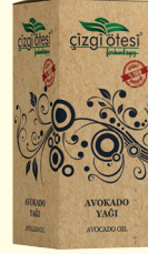
AVOKADO YAĞI - 20 cc - Ürün Kodu: 3306

*Astım, bronşit ve faranjitte, *Kalp yetmezliğinde, *İdrar tutamamada, *Sinüzitte, *Hazımsızlık ve gaz problemlerinde, *Mesane ve idrar yolları enfeksiyonlarında, *Soğuk algınlığı ve öksürükte, *Romatizmal hastalıklarda ve Gut hastalığında, *Burkma, çarpma gibi sorunlarda, *Diyabet, felç, bacak tutulmaları ve kramplarında, *Selülit, egzama, sedef gibi cilt sorunlarında, *Ağrı dindirmede ve hareket kabiliyetini artırmada, *Cinsel isteği artırmada, enerji vermede ve sinirleri kuvvetlendirmede yardımcı ve destekleyicidir.