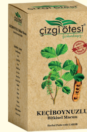
KEÇİBOYNUZLU Bitkisel Macun (KÜR) - 420 gr - Ürün Kodu: 2205

İÇİNDEKİLER: Keçiboynuzu, Polen, Tarçın, Yulaf Unu, Soya Unu, Kakao. FAYDALARI: *Kansızlıkta, *Sindirim sistemi sorunlarında, *Kabızlık ve gaz sorunlarında, *Çocukların kemik ve kas gelişiminde, *İştah açmada ve enerji verdimede, *Kilo aldırmada, *Cinsel isteği ve duyarlılığı artırmada, *Sperm sayısını ve kalitesini yükseltmede yardımcı ve destekleyicidir.