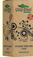
ANASON TOHUMU YAĞI - 20 cc - Ürün Kodu: 3304

*Soğuk algınlığı, nefes darlığı, astım, bronşit ve koahta, *Faranjite, dişeti kanaması ve çekilmesinde, *Balgam söktürmede, *Kanı temizlemede ve yara iyileştirmede, *Adet düzensizliği ve hormonal bozukluklarda, *Menopoz sıkıntılarında, *Romatizma ve mafsal ağrılarında, *Bağırsak yaralarında, *Ülser, gastrit gibi mide sorunlarında, *Sedef, egzama, akne gibi cilt sorunlarında, *Bebeklerde gaz sorununda, *Mide gazını gidermede, idrar söktürmede, *Saç ve cilt bakımında yardımcı ve destekleyicidir.