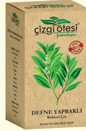
DEFNE YAPRAKLI Bitkisel Çay (KÜR) - 130 gr - Ürün Kodu: 1105

İÇİNDEKİLER: Civan perçemi, Altınotu, Mersin Yaprađı, Isırgan, Aslan Pençesi, Sarı Kantaron, Kırkkilit Otu, Tıbbi Nane, Ebegümeçi, Kekik, Şerbetçiotu. FAYDALARI: *Adet sorunlarında, *Miyom ve kist tedavisinde, *Ađrılı ve sancılı adet görmede, *Kemik erimesinde, *İdrar yolları rahatsızlıklarında, *Yüksek ateşte, *Hormonal bozukluklarda, *Menopoz dönemi sorunlarında, *Ödem çözmede ve iltihap kurutmada yardımcı ve destekleyicidir.