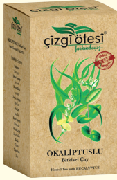
ÖKALİPTUSLU Bitkisel Çay (KÜR) - 130 gr - Ürün Kodu: 1111

İÇİNDEKİLER: Meyan Kökü, Defne Yapağı, Ebegümesi, Kırkkilit Otu, Mısır Püskülü, Rumi Papatya, Zeytin yapağı, Kiraz Meyve sapı. FAYDALARI: *Böbrek rahatsızlıklarında, *Böbrek taşı ve kumarının düşürülmesinde, *Safr Kesesi sorunlarında, *Kanı temizlemede, *İdrar söktürmede ve iltihap kurutmada, *İdrar yolları enfeksiyonunda, *Sindirimi düzenlemede yardımcı ve destekleyicidir.