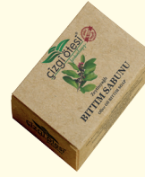
BITTİM SABUNU - 100 gr - Ürün Kodu: 4409

*Saç dökülmesi, kepeklenme ve selülit sorunlarını giderir. *Mantar, egzama, sedef ve zona gibi cilt sorunlarında etkilidir. *Sivilceli ve sorunlu ciltlerde kullanılır. *Cilt üzerinde tahrişe karşı etkilidir. *İçerisinde bulunan ardiç kokusu nefes açıcı ve zindelik vericidir.