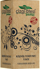
KİŞNİŞ TOHUMU YAĞI - 20 cc - Ürün Kodu: 3328

*Antiseptiktir. *Hazımsızlıkta, *İştahsızlıkta, *Mide ve barsaklardaki gaz sorunlarında, *Mide kramplarında ve karın ağrılarında, *Romatizme ve eklem ağrılarında, *Hafızayı güçlendirmede, *Sinirsel baş ağrılarını gidermede, *Sinir sistemini güçlendirmede, *Ayrıca; Migren, Sedef, Egzema, Kabızlık, Kolesterol, Boyun ve Bel Fıtığı, Kireçlenme, Astım, Bronşit, Guatr, Bademcik İltihabı, Mide Ülseri, Basur (Hemeroid), Sinüzit, Felç ve Diyabet gibi hastalıkların tedavisinde yardımcı ve destekleyicidir.