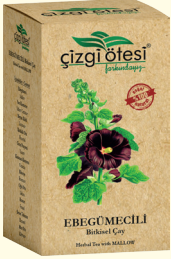
EBEGÜMECİLİ Bitkisel Çay (KÜR) - 130 gr - Ürün Kodu: 1106

İÇİNDEKİLER: Ebegümece, Sarı Kantaron, Meyan kökü, Kırkkilit Otu, Altınotu, Civanperçemi, Biberiye, Oğulotu, Rezene, Kimyon, Keten Tohumu. FAYDALARI: *Mide (Ülser, Gastrit, Reflü vs.) rahatsızlıklarında, *Mide de yanma, ekşime ve şişkinlikte, *Stres kökenli mide sorunlarında, *Sinir sistemini yatıştırma, *Bağırsak faaliyetlerini düzenleme, *Mide ve bağırsaklarda gaz sorunlarının giderilmesinde, *Vücutu zinde tutmada yardımcı ve destekleyicidir.