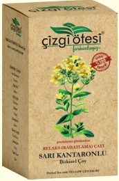
geçmişten günümüze RELAKS (RAHATLAMA) ÇAYI

İÇİNDEKİLER: Okaliptus Yapağı, Defne Yapağı, Meyan kökü, Zeytin yapağı, Adaçayı, Rumi Papatya, Kekik, Tıbbi Nane, Hatmiçiçeği. FAYDALARI: *Astım, bronşit, koah ve amfizemde, *Sinüzit tedavisinde, *Öksürük ve balgamda, *Bademcik ve boğaz iltihabı ve ağrısında, *Nezle, grip ve soğuk algınlığında, *Nefes darlığında, *Ateş düşürmede, *Göğüsü yumuşatmada, *Bağışıklık sistemini güçlendirmede yardımcı ve destekleyicidir.