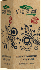
DEFNE TOHUMU (GAR) YAĞI - 20 cc - Ürün Kodu: 3312

*Nefes darlığında, *Öksürükte, *Soğuk algınlığında, *Kan şekerini dengelemede, *Romatizma ve adele ağrılarında, *Bademcik iltihabı ve gribal enfeksiyonlarda (Gargara şeklinde uygulandığında), *Mantarda, *Saç, kaş ve kirpiklerin hızlı uzamasında, *Kas gevşetmede, göğüs yumuşatmada, gaz gidermede, mikrop öldürmede ve terletmede yardımcı ve destekleyicidir.