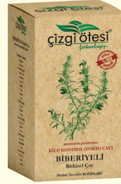
geçmişten günümüze KİLO KONTROL (FORM) ÇAYI

İÇİNDEKİLER: Bamyra Çiçeđi, Kekik, Isırgan, Zeytin Yaprađı, Yavşanotu, Defne Yaprađı, Bögürtlen Yaprađı, Mersin Yaprađı. FAYDALARI: *Kan şekeri, kolesterol ve tansiyonu dengelemede, *Vücut direncini artırmada, "Vücutta kollajen üretimini artırmada, *Kemik, kırıkdađ, lif ve eklem sorunlarının giderilmesinde, *Kanı temizlemede, *Şeker (Diyabet) hastalığına bađlı ađız kokusu ve kurumasını gidermede, *Şekere dayalı streste, *Vücutu ferahlatmada, yatıştırımda yardımcı ve destekleyicidir.