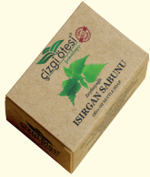
İSIRGAN SABUNU - 100 gr - Ürün Kodu: 4411

*Derideki gözenekleri açar ve cildi rahatlatır. *Saçları kepeğe karşı korur ve saç dökülmesini önler. *Saç diplerindeki yara ve tahrişleri iyileştirir. *Siyah noktaları, ergenlik sivilcelerini ve çocuklarda pişiği giderir. *Egzama, sedef, mantar gibi cilt hastalıklarının giderilmesinde yardımcı ve destekleyicidir. *Doğal kokusundan ve antiseptik oluşundan dolayı dolaplarda kullanıldığında haşere barınmasını engeller.