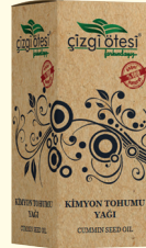
KİMYON TOHUMU YAĞI - 20 cc - Ürün Kodu: 3327

*Antiseptiktir. *Astım, bronşit, nezle ve gripte, *Solunum yolu rahatsızlıklarında, *Dişeti iltihabında, *Safra artırmada ve kurt düşürmede, *Kötü kolesterolde, *Kan şekerini dengelemede, *Alyuvar oluşumunu artırmada, *Mide krampları ve bulantısında, *Romatizmal hastalıklarda, *Damar tıkanıklığında, *Yara ve yanıklarda, *Bölgesel zayıflamada yardımcı ve destekleyicidir.