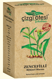
ZENCEFİLLİ Bitkisel Macun (KÜR) - 420 gr - Ürün Kodu: 2208

İÇİNDEKİLER: Nar Ekşisi, Sandalos Sakızı, Sinameki, Anason, Ardiç Tohumu, Biberiye, Defne Yaprağı, Ketan Tohumu, Mersin Yaprağı, Papatya, Rezene, Şahtere, Kekik, Glikoz Şurubu. FAYDALARI: *İştah kesmede ve kilo verdimde, *Kabızlık'ta, *Sindirimi kolaylaştırıcı, *Metabolizmayı hızlandırarak kalori tüketimini artırmada, *Vücudun yağ depolamasını önlemede, *Kan şekerini düşürmede, *Tansiyonu ve kolesterolü dengelemede, *İdrar söktürmede, ödem atılımında, *Mide ve bağırsaklarda gaz sorunlarının giderilmesinde, *Böbrek kum ve taşlarının düşürülmesinde yardımcı ve destekleyicidir.