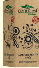
ÇAMTEREBENTİN YAĞI - 20 cc - Ürün Kodu: 3310

*Hafızayı güçlendirmede, *Dikkat dağınıklığında, *Öksürükte, *Kötü kolesterolü düşürmede, *Kanı temizlemede, *Kan şekerini dengelemede, *Kalp ve damar hastalıklarından korunmada, *Romatizmal ağrılarda, *Safrayı artırmada, sinir sistemini güçlendirmede, *Cildi nemlendirme, besleme ve kırışıklıkları gidermede, *Bronzlaşmada, saç ve cilt bakımında, *Yıpranmış ciltlerde, göz ve dudak çevresi gibi hassas bölgelerin bakımında yardımcı ve destekleyicidir.