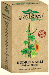
KUDRETNARLI Bitkisel Macun (KÜR) - 420 gr - Ürün Kodu: 2206

İÇİNDEKİLER: Kudret Narı, Polen, Ebegümeci, Meyan Kökü, Sandalos Sakızı, Kantaron, Oğulotu, Kırkkilit Otu, Civanperçemi, Biberiye, Rezene, Kimyon, Çiçek Balı, Glikoz Şurubu. FAYDALARI: *Mide (Ülser, Gastrit, Reflü vs.) rahatsızlıklarında, *Mide de yanma, ekşime ve şişkinlikte, *Stres kökenli mide sorunlarında, *Sinir sistemini yatıştırıcı, *Bağırsak faaliyetlerini düzenlemede, *Mide ve bağırsaklarda gaz sorunlarının giderilmesinde, *Vücudu zinde tutmada yardımcı ve destekleyicidir.