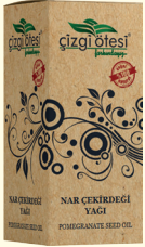
NAR ÇEKİRDEĞİ YAĞI - 20 cc - Ürün Kodu: 3334

*Nezle, grip, soğuk algınlığı ve boğaz ağrısında, *Hafızayı güçlendirmede, *Mide yanmasında, *Damar tıkanıklıklarında, *Kanı temizlemede, *İdrar söktürmede, *Böbrek taşı ve kumunu düşürmede, *Kasları kuvvetlendirmede, *Eklem ağrılarının giderilmesinde, *Selülit ve kırışıklıkların giderilmesinde, *İstenmeyen yağları vücuttan atmada, *Böcek ve sinek ısırıklarında, *Dişlerin beyazlatılmasında, *Sivilce ve aknelerin giderilmesinde yardımcı ve destekleyicidir. *Ayrıca ciltte tonik olarak kullanılabilir.