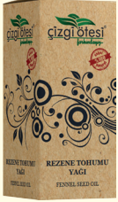
REZENE TOHUMU YAĞI - 20 cc - Ürün Kodu: 3340

*Balgamda, *İltihapta, *Krampta, *Soğuk algınlığında, *Hazımsızlıkta, *Mide şişkinliğinde, *Menopoz dönemi sorunlarında, *Kemik erimesinde, *Bağırsak hastalıklarında, *Gaz sorunlarında, *Anne sütünü artırmada, *Selülitte, *Cilt yüzeyindeki pürüzleri gidermede ve cildi beslemede, *Göğüs büyütmede, cildi dolgunlaştırmada Anason, Çörekotu, Keten Tohumu ve Mersin yağı ile birlikte kullanıldığına yardımcı ve destekleyicidir.