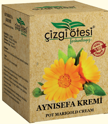
AYNI SEFA KREMİ - 40 cc - Ürün Kodu: 4401

İÇİNDEKİLER: Aynı Sefa Çiçeği Özü, Yasemin Yağı, Balmumu.