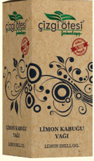
LİMON KABUĞU YAĞI - 20 cc - Ürün Kodu: 3332

*Nezle, grip, soğuk algınlığı ve boğaz ağrısında, *Hafızayı güçlendirmede, *Mide yanmasında, *Damar tıkanıklıklarında, *Kanı temizlemede, *İdrar söktürmede, *Böbrek taşı ve kumunu düşürmede, *Kasları kuvvetlendirmede, *Eklem ağrılarının giderilmesinde, *Selülit ve kırışıklıkların giderilmesinde, *İstenmeyen yağları vücuttan atmada, *Böcek ve sinek ısırıklarında, *Dişlerin beyazlatılmasında, *Sivilce ve aknelerin giderilmesinde yardımcı ve destekleyicidir. *Ayrıca ciltte tonik olarak kullanılabilir.