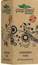
ACIBADEM YAĞI - 20 cc - Ürün Kodu: 3301

*Kan şekerini düşürmede, *Kolesterol ve tansiyonu dengelemede, *Kemik erimesini sorununda, *İdrar yolları iltihabında, *Stres, sinir ve uykusuzlukta, *Kabızlıkta, *Öksürükte, *Zihinsel ve bedensel yorgunlukta, *Tenya ve kılkurdu düşürmede, idrar söktürmede, *Kuru ve çatlak cilt sorunlarının giderilmesinde yardımcı ve destekleyicidir.