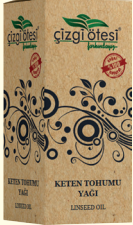
KETEN TOHUMU YAĞI - 20 cc - Ürün Kodu: 3326

*Hücre yenileyici ve antioksidandır. *Bağırsak parazitlerinin giderilmesinde, *Sedef ve egzamada, *Cilt temizliğinde, *Kırıksıklıkların giderilmesinde, *Cilde canlılık, yumuşaklık ve pürüzsüz bir görünüm kazandırmada, *Göz ve dudak çevresi gibi hassas bölgelerin bakımında yardımcı ve destekleyicidir.