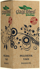
PELESENK YAĞI- 20 cc - Ürün Kodu: 3338

*Fiziksel ve ruhsal bir rahatlatıcıdır. *Bademcik ve dişeti iltihabında (gargara yapılır), *Yanıklarda (güneş yanıkları ve lekeleri dahil), *Akne tedavisinde, *Depresyon, korku, histeri ve gerilimi yatıştırır, *Gözaltı torbalarının giderilmesinde, *Cildin beslenip pürüzsüzleştirilmesinde, *Saç dökülmesi ve saç bakımında yardımcı ve destekleyicidir. *Yumuşatıcı ve rahatlatıcı olduğundan hassas ciltler için tavsiye edilir.