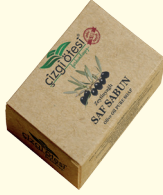
SAF SABUN - 100 gr - Ürün Kodu: 4416

*Cildi tahriş etmeden temizler ve ciltte doğal bir koruma sağlar. *Cilde tazelik ve canlılık kazandırır. *Yatıştırıcı olup, uykusuzluk, sinirlilik ve depresyon hallerinde etkilidir. *İltihaplanmayı önleyici ve hücre yenileyicidir. *Zona hastalığında tedaviye yardımcıdır. *Akneli ciltler ve kepekli saçlarda etkilidir. *Saça parlaklık ve yumuşaklık kazandırır.