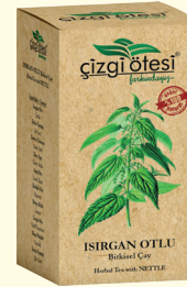
ISIRGAN OTLU Bitkisel Çay (KÜR) - 130 gr - Ürün Kodu: 1109

İÇİNDEKİLER: Funda Yaprağı, Kekik, Çoban Çökerten, Böğürtlen Yaprağı, Karabaş Otu, Isırgan, Biberiye, Defne, Bıyık Çiçeği. FAYDALARI: *Kolesterol ve tansiyonu dengeleme, *Kanı temizleme, *Kandaki yağlanmayı önleme, *Damar tıkanıklığını giderme, *Kalp ritmini düzenleme, *Sinirleri ve kalbi güçlendirme, *Kan şekerini düzenleme, *Vücutu rahatlatmada ve sakinleştirmede yardımcı ve destekleyicidir.