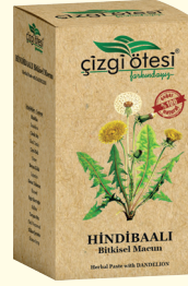
HİNDİBAALI Bitkisel Macun (KÜR) - 420 gr - Ürün Kodu: 2203

İÇİNDEKİLER: Ayrikotu, Kudretnarı, Civanperçemi, Defne Yaprağı, Çiçek Balı, Ebegü-meci, İsrırgan Otu, Kırıkkilitotu, Meyan Kökü, Sığırkuyruğu, Yavşan, Kekik, Glikoz Şurubu. FAYDALARI: *İç ve dış hemoroit (basur)'te, *Basur memelerinin giderilmesinde, *Mide ve bağırsakların düzenli çalışmasında, *Hazımsızlık ve kabızlık'ta, *Anüste yanma, acı, kaşıntı ve sancıyı gidermede, *Kanı temizlemede, *Kalın bağırsak iltihabında ve kanamalarında, *Sindirim sistemi sorunlarının giderilmesinde, *Bağırsak parazitlerini temizlemede ve kolitte, *Yara iyileştirmede yardımcı ve destekleyicidir.