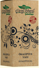
ÖKALİPTUS YAĞI - 20 cc - Ürün Kodu: 3336

*Nezle ve soğuk algınlığında, *Astım, bronşit, koah ve amfizemde, *Solunum yolu rahatsızlıklarında, *Öksürükte, *Kabızlıkta, *Sinüzitte, *Şeker hastalığında, *Romatizmal ağrılarda, *Dişeti ve ağız içi rahatsızlıklarda, *Sindirim sistemi sorunlarında, *Mikrop öldürmede ve kas gevşetmede, *Saç dökülmesinde ve kepeklenmeyi gidermede yardımcı ve destekleyicidir.