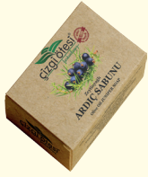
ARDIÇ SABUNU - 100 gr - Ürün Kodu: 4408

*Saç dökülmesi, kepeklenme ve selülit sorunlarını giderir. *Mantar, egzama, sedef ve zona gibi cilt sorunlarında etkilidir. *Sivilceli ve sorunlu ciltlerde kullanılır. *Cilt üzerinde tahrişe karşı etkilidir. *İçerisinde bulunan ardiç kokusu nefes açıcı ve zindelik vericidir.