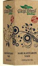
SARI KANTARON YAĞI - 20 cc - Ürün Kodu: 3341

*Kolesterol ve tansiyonun dengelenmesinde, *Bağırsak solucanlarının düşürülmesinde, *Damar sertliğini önlemede ve kalbi kuvvetlendirmede, *Ödem atılmasında, *Böbrek taşlarının düşürülmesinde ve oluşumunu önlemede, *Grip, tifo ve difteri gibi salgın hastalıkların tedavisinde, *Astım, bronşit ve veremde, *Nefes darlığı ve öksürükte, *Balgam söktürmede, *Saç kıran tedavisinde, *Saç kırılmasında ve dökülmesinde, *Saçların uzamasında yardımcı ve destekleyici olup antiseptiktir.