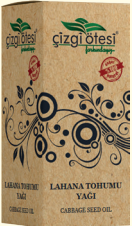
LAHANA TOHUMU YAĞI - 20 cc - Ürün Kodu: 3330

*Antiseptiktir. *Hazımsızlıkta, *İştahsızlıkta, *Mide ve barsaklardaki gaz sorunlarında, *Mide kramplarında ve karın ağrılarında, *Romatizme ve eklem ağrılarında, *Hafızayı güçlendirmede, *Sinirsel baş ağrılarını gidermede, *Sinir sistemini güçlendirmede, *Ayrıca; Migren, Sedef, Egzema, Kabızlık, Kolesterol, Boyun ve Bel Fıtığı, Kireçlenme, Astım, Bronşit, Guatr, Bademcik İltihabı, Mide Ülseri, Basur (Hemeroid), Sinüzit, Felç ve Diyabet gibi hastalıkların tedavisinde yardımcı ve destekleyicidir.