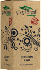
GLİSERİN YAĞI - 20 cc - Ürün Kodu: 3314

*Kalp ve damar hastalıklarında, *Kan yapımında ve kan değerlerini düzenlemede, *Damar tıkanıklıklarını önlemede, *Böbrek ağrıları, taş ve kumlarının düşürülmesinde, *Kolesterol ve tansiyonun dengelenmesinde, *Hazımsızlıkta, *Tenya, kılkurdu ve barsak solucanlarını düşürmede, *Sara (epilepsi) hastalığında, *Beden ve zihin yorgunluğunda, *Varis tedavisinde, *Kepeklenme ve saç dökülmesi sorununun giderilmesinde yardımcı ve destekleyicidir.