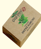
DEFNE SABUNU - 100 gr - Ürün Kodu: 4410

*Saç dökülmesini ve kepeği önler, saçları besler ve yumuşatır. *Saçlara doğal parlaklık ve canlı bir görünüm kazandırır. *Kuru saçları nemlendirir. *Saç diplerinde bakteri oluşumunu engeller. *Kaşıntıyı giderir. *Gözenekleri açar, vücudu rahatlatır. *Antiseptik oluşundan, egzema, sedef ve mantar gibi deri hastalıklarının bir çoğunda, ergenlik sivilcelerinde, saç diplerindeki yara ve tahrişlerin giderilmesinde yardımcı ve destekleyicidir. *Varisleri rahatlatmada kullanılır.