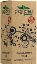
KARABAŞOTU YAĞI - 20 cc - Ürün Kodu: 3322

*Cilt kırıksıklıklarında, *İltihaplı egzamada, *Selülit tedavisinde, *Akneleri gidermede, *Cildin nem dengesini sağlamada, *Ciltteki yanmayı ve dökülmeyi hafifletmede, *Sivilceli, lekeli ve yıpranmış ciltlerin bakımında, *Doğum sonrası çatlakların giderilmesinde, *El ve ayak çatlaklarında, *Cilde esneklik kazandırarak ayak, karnı ve bacadaki çatlakları gidermede ve önlemede, *Saçların güçlenmesini, uzamasını ve kolayca şekillenmesini sağlamada, *Saçta kepek oluşumunu önlemede, *Saça parlaklık ve yumuşak kazandırmada, *Göz makyajı dahil olmak üzere cildin temizlenmesinde yardımcı ve destekleyicidir.