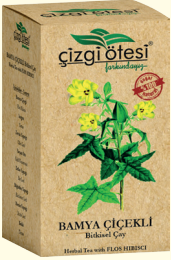
BAMYA ÇİÇEKLİ Bitkisel Çay (KÜR) - 130 gr - Ürün Kodu: 1102

İÇİNDEKİLER: Bamyra Çiçeđi, Kekik, Isırgan, Zeytin Yaprađı, Yavşanotu, Defne Yaprađı, Bögürtlen Yaprađı, Mersin Yaprađı. FAYDALARI: *Kan şekeri, kolesterol ve tansiyonu dengelemede, *Vücut direncini artırmada, "Vücutta kollajen üretimini artırmada, *Kemik, kırıkdađ, lif ve eklem sorunlarının giderilmesinde, *Kanı temizlemede, *Şeker (Diyabet) hastalığına bađlı ađız kokusu ve kurumasını gidermede, *Şekere dayalı streste, *Vücutu ferahlatmada, yatıştırımda yardımcı ve destekleyicidir.