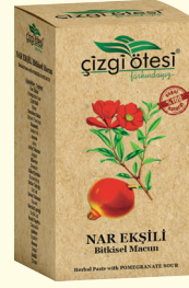
NAR EKŞİLİ Bitkisel Macun (KÜR) - 420 gr - Ürün Kodu: 2207

İÇİNDEKİLER: Kudret Narı, Polen, Ebegümeci, Meyan Kökü, Sandalos Sakızı, Kantaron, Oğulotu, Kırkkilit Otu, Civanperçemi, Biberiye, Rezene, Kimyon, Çiçek Balı, Glikoz Şurubu. FAYDALARI: *Mide (Ülser, Gastrit, Reflü vs.) rahatsızlıklarında, *Mide de yanma, ekşime ve şişkinlikte, *Stres kökenli mide sorunlarında, *Sinir sistemini yatıştırıcı, *Bağırsak faaliyetlerini düzenlemede, *Mide ve bağırsaklarda gaz sorunlarının giderilmesinde, *Vücudu zinde tutmada yardımcı ve destekleyicidir.