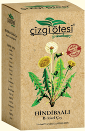
HİNDİBAALI Bitkisel Çay (KÜR) - 130 gr - Ürün Kodu: 1108

İÇİNDEKİLER: Ebegümece, Sarı Kantaron, Meyan kökü, Kırkkilit Otu, Altınotu, Civanperçemi, Biberiye, Oğulotu, Rezene, Kimyon, Keten Tohumu. FAYDALARI: *Mide (Ülser, Gastrit, Reflü vs.) rahatsızlıklarında, *Mide de yanma, ekşime ve şişkinlikte, *Stres kökenli mide sorunlarında, *Sinir sistemini yatıştırma, *Bağırsak faaliyetlerini düzenleme, *Mide ve bağırsaklarda gaz sorunlarının giderilmesinde, *Vücutu zinde tutmada yardımcı ve destekleyicidir.