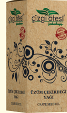
ÜZÜM ÇEKİRDEĞİ YAĞI - 20 cc - Ürün Kodu: 3345

*Kabızlıkta, *Sedef ve egzamada, *Yara ve yanıklarda, *Öksürükte, *Bağırsak parazitlerinde, *Kuru ve çatlak ciltleri nemlendirmede, *Saç kuruluşu ve dökülmesinde, *Göz ve dudak çevresi gibi hassas bölgelerin bakımında, *Saç, kaş ve kirpiklerin daha güv ve sağlıklı olmasında, *Saçlara parlaklık ve canlılık kazandırmada yardımcı ve destekleyicidir.