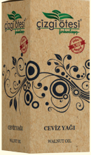
ÇEVİZ YAĞI - 20 cc - Ürün Kodu: 3309

*Hafızayı güçlendirmede, *Dikkat dağınıklığında, *Öksürükte, *Kötü kolesterolü düşürmede, *Kanı temizlemede, *Kan şekerini dengelemede, *Kalp ve damar hastalıklarından korunmada, *Romatizmal ağrılarda, *Safrayı artırmada, sinir sistemini güçlendirmede, *Cildi nemlendirme, besleme ve kırışıklıkları gidermede, *Bronzlaşmada, saç ve cilt bakımında, *Yıpranmış ciltlerde, göz ve dudak çevresi gibi hassas bölgelerin bakımında yardımcı ve destekleyicidir.