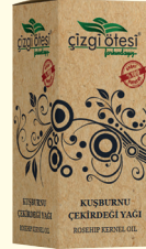
KUŞBURNU ÇEKİRDEĞİ YAĞI - 20 cc - Ürün Kodu: 3329

*Bölgesel incelleme ve zayıflamada, *Cildin sıkılaşmasında, gerginleşmesinde ve pürüzsüzleşmesinde, *Cildin derinlemesine beslenmesinde ve yenilenmesinde, *Yoğun nemlendirici etkisi ile cilt kuruluğunun giderilmesinde, *Selülit sonucu oluşan portakal kabuğu görünümünün yok olmasında, *Lenf ve kan dolaşımını hızlandırmada, *Ölü derinin atılmasında, *Cildin canlanmasında, esneklik ve parlaklık kazanmasında, *Yağ ve su metabolizmasını harekete geçirerek sarkma problemi olan bölgeleri toparlamada yardımcı ve destekleyicidir.