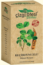
KEÇİBOYNUZLU Bitkisel Karışım (KÜR) - 200 gr - Ürün Kodu: 2204

İÇİNDEKİLER: Hindiba, Çörekotu, Meyan Kökü, Çiçek Balı, Keten Tohumu, Glikoz Şurubu. FAYDALARI: *Karaciğer işlevlerini düzenlemede, *Karaciğer tembelliği ve yağlanması, *Hepatit ve sarılıkta, *Karaciğere bağlı cilt sorunlarında, *Sindirim sorunlarını gidermede, *Kan dolaşımını düzenlemede ve kanı temizlemede, *Mide kramplarında, *İltihap kurutmada yardımcı ve destekleyicidir.